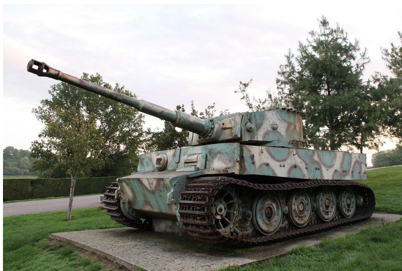
Tiger-stridsvagnen i Vimoutiers stred i Normandie med schwere SS-Panzer-Abteilung 102, ingående i 10. SS-pansardivisionen. Självklart ska vi besöka och klappa Tigern på vår resa!