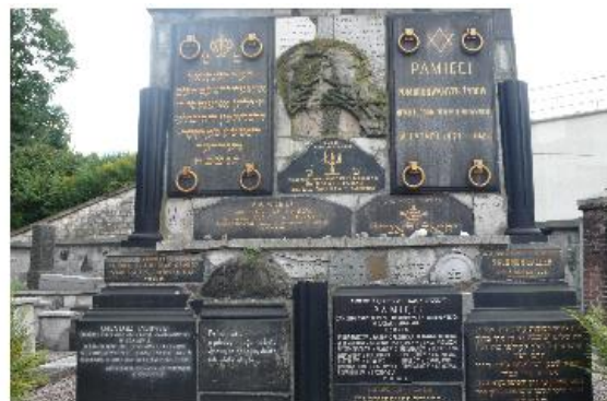
Bilder från Auschwitz, Krakow och Oskar Schindlers kontor.