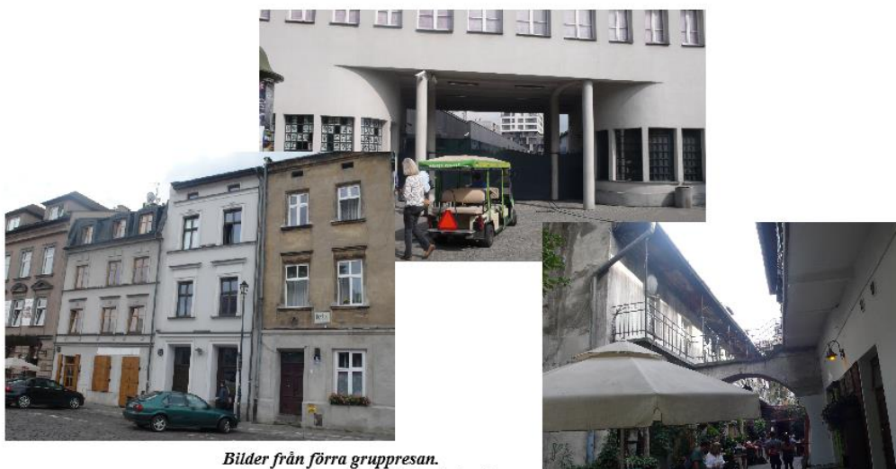
Bilder från förra gruppresan. Från vänster: Krakows f.d. judiska ghetto som platsen ser ut idag, Schindlers fabrik, plats för inspelningen av en av scenerna i filmen Schindlers List.