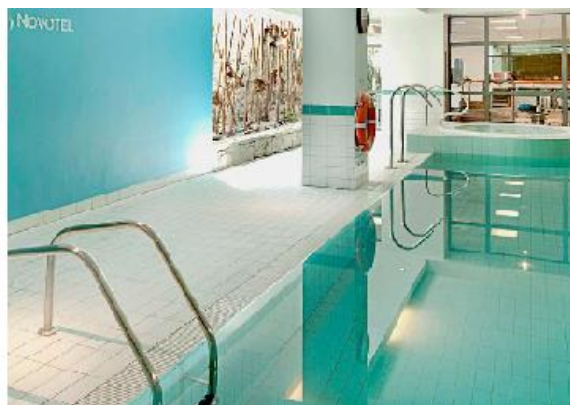
Bilder från hotellet som ingår i resans pris.